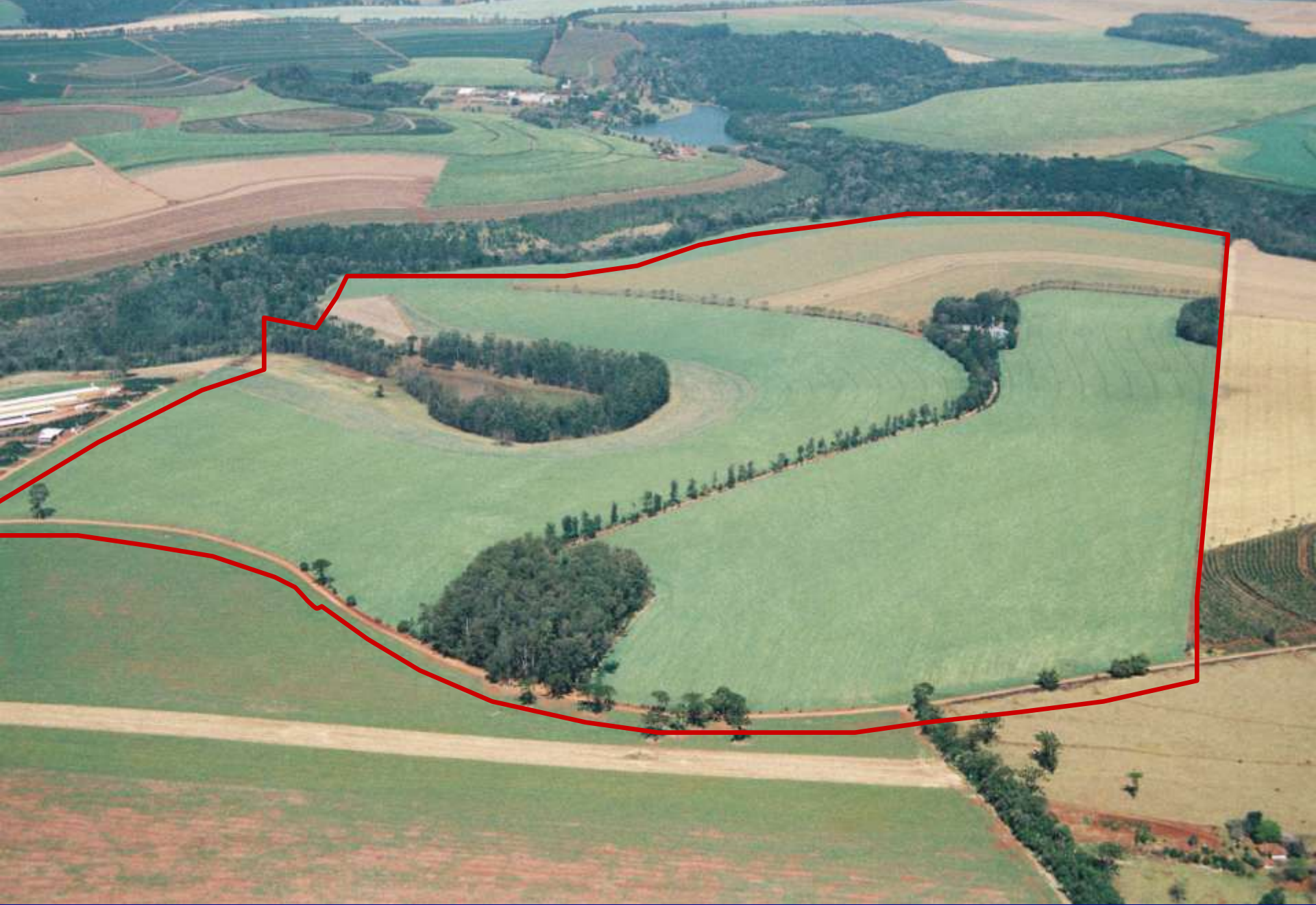
Rhenânia Farm - 2007